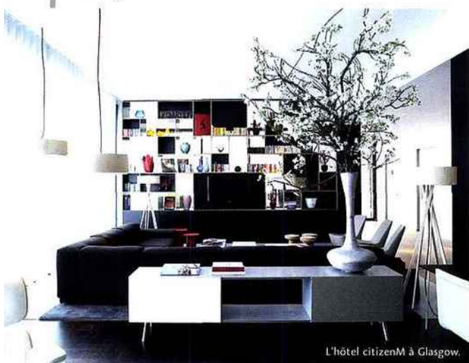
L'hôtel citizenM à Glasgow.