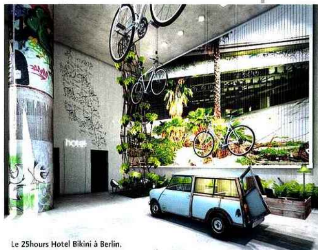
Le 25hours Hotel Bikini à Berlin.